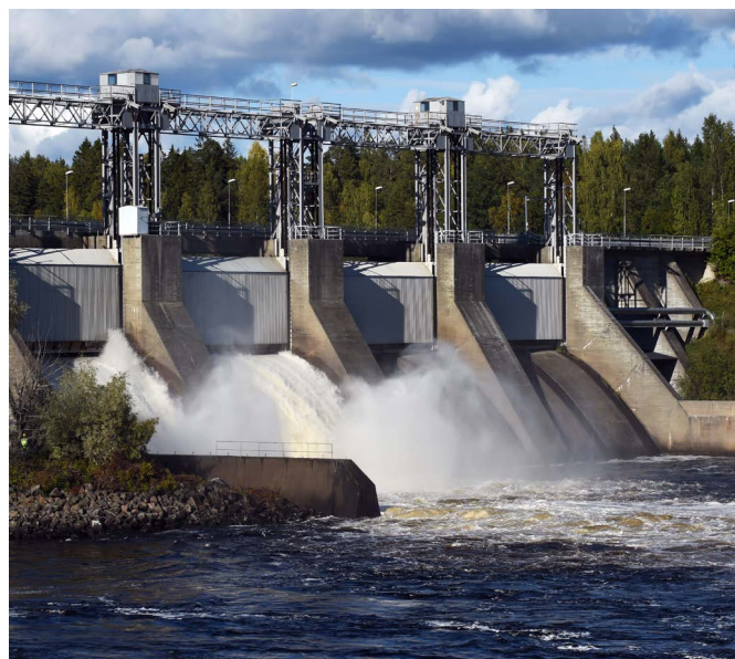
Ljusne strömmar, Suède

Fortum a la conviction qu'un secteur énergétique ouvert et bien régulé sera le plus à même d'investir, d'innover et d'améliorer continuellement ses activités, pour répondre aux besoins futurs d'électricité faiblement émettrice de gaz à effet de serre. A terme, nous espérons voir émerger un marché paneuropéen de l'électricité, partageant les bienfaits d'une génération « sans carbone » par-delà les frontières, en accord avec les objectifs de l'Union européenne en matière d'énergies renouvelables.